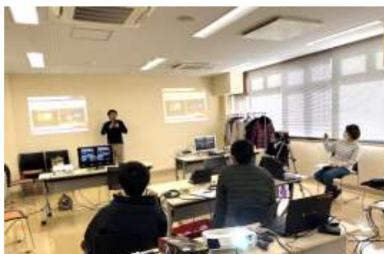
生活講座「ビデオ・スイッチングを覚えよう」