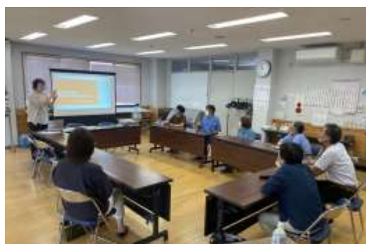
生活講座「防災について」